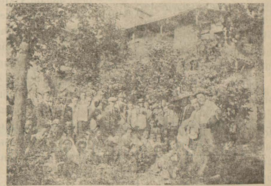
Dört yolda Bir Portakal Bahçesi

Payas, 16 [Hususî] — Burada şâyialara göre Irak'tan Filistin'e; Mar'din, Toprakale, Payas, İskenderun yoluyla dört ayda yedi bin vagon hububat geçecektir. Bu yolla geçecek olan buğdayı İskenderuna kadar novtunu elli bir lira tutarken kumpanya nakliyatı taahhüt ederek mühim tenzilât yapmış ve novtunu 17 liraya indirmiştir.